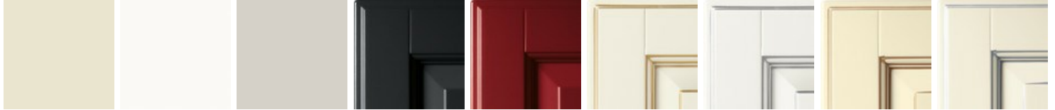
米色 白色 浅灰色 黑 红 白色带金色描边 白色带银色描边 米色带金色描边 米色带银色描边 黑色带金色描边 黑色带银色描边 红色带金色描边 红色带银色描边 钛灰色 水貂色 (Mink) 火山灰 苍鹭灰