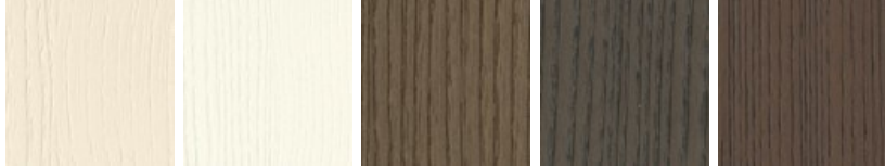
白栎木 (White Ash)