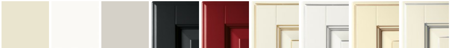
米色 白色 浅灰色 黑 红 白色带金色描边 白色带银色描边 米色带金色描边 米色带银色描边 黑色带金色描边 黑色带银色描边 红色带金色描边 红色带银色描边 钛灰色 水貂色 (Mink) 火山灰 苍鹭灰